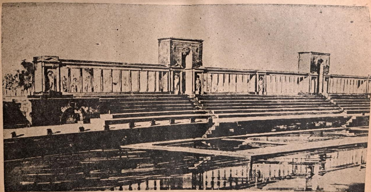
Эскиз водного стадиона на проспекте Сталинских ударников. Перспектива.